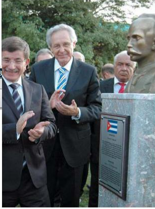
Merkezin bahçesinde, Latin Amerika'nın önemli devlet adamlarının büstleri yer alıyor. İçerde de Osmanlı Devleti döneminde hazırlanan bir Latin Amerika haritası bulunuyor. (Kapak fotoğrafı)

Türkiye'nin Latin Amerika ülkelerinde, Latin Amerika'nın da ülkemizde daha geniş bir anlamda tanınmasına yönelik bilimsel çalışmalar yapmak üzere kurulan Ankara Üniversitesi Latin Amerika Çalışmaları Araştırma ve Uygulama Merkezi (LAMER), 29 Temmuz 2009'da düzenlenen törenle açıldı.